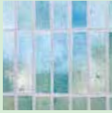
天王公園の桜の灰を使用した 津島オリジナルタイル